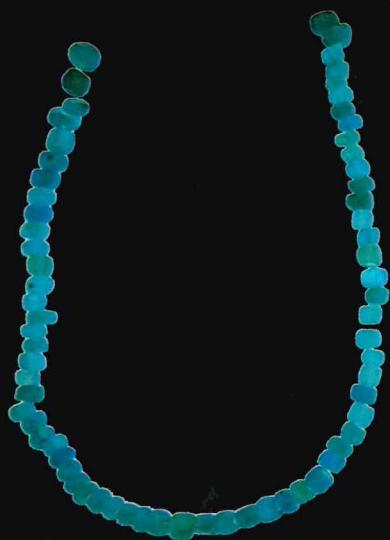
ガラス小玉 (山元遺跡)