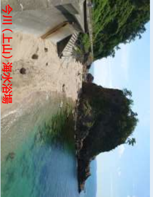
今川(上山)海水浴場